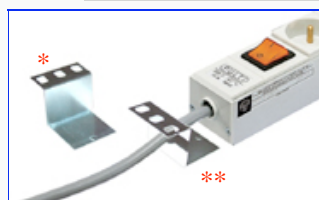
127005/127036 : Скобы PE – Установка на передней панели стойки 19"