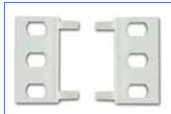
Новые крепежные скобы

Набор скоб для оптимальной установки в стойки в любых положениях.