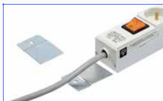
127000 : Скобы PB – Плоская установка