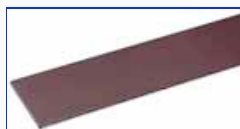
Магнитная приклеивающаяся пластинка