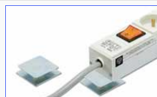
127003 : Скобы PB – Установка на перегородку или станину